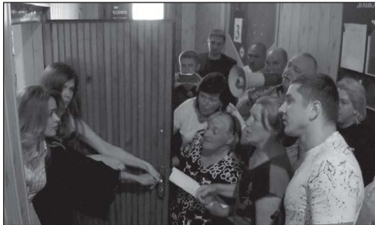
Засідання суду зумисне зробили закритим, тому людям потрапити на нього зась.

начальник Шевченківського відділення поліції. На виклик 102. Роз'яснює, що зараз в суді - порушення громадського порядку, зриваються засідання... Лінія 102 минулого року, коли стріляли в людей, чомусь не спрацювала... А тут - вмиль.